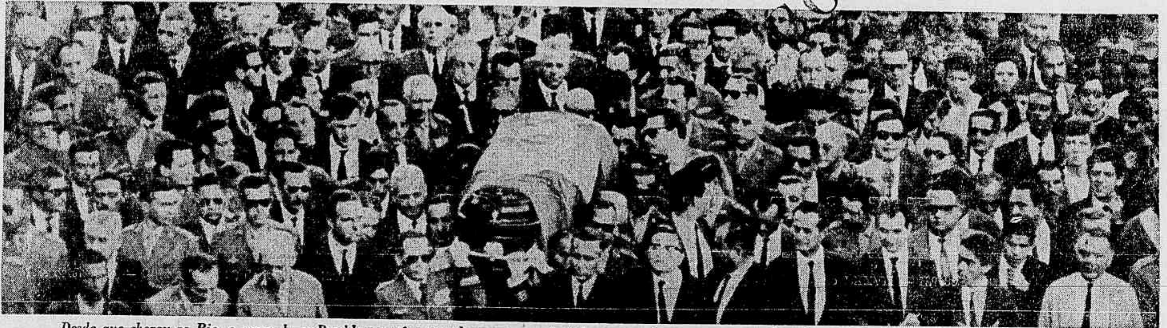
Desde que chegou no Rio, o corpo do ex-Presidente esteve cercado por pessoas de todas as camadas, representantes de todos os setores, companheiros de vida militar e civil